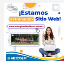
Estrenamos nuevo diseño en nuestro sitio web