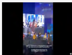
Nuestros egresados reciben premio de distinción por mejores promedios en Prepa Tec