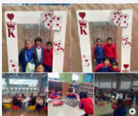
Visita al Centro Cultural "Manuel Gómez Morin"